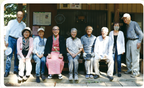
高橋家屋敷林保存会の皆さんと