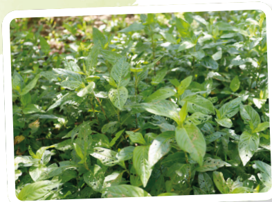
タデアイ(藍) 花期8~10月