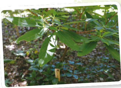
ミツマタ(三叉) 花期3~4月