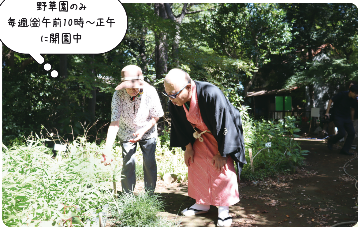
ボランティアから説明を受ける様子