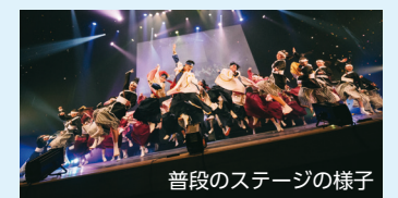
普段のステージの様子

「郷人からのメッセージ」 福島県南会津郡下郷町を拠点に活動しております。昨年改名した「舞道郷人」とは会津の歴史を舞い、伝える、私たちの道という意味を込めております。4年ぶりにこの地で踊れることをとても楽しみにして参りました。精いっぱい演舞しますので声援よろしくお願ひいたします。