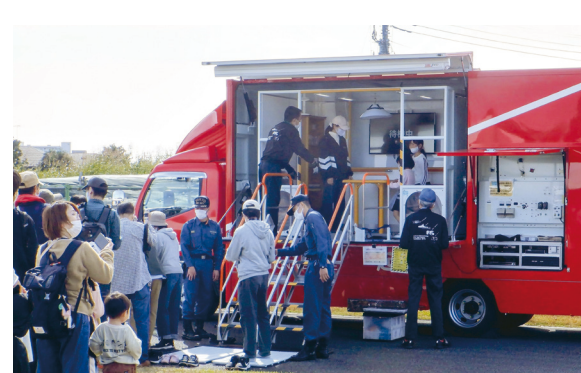
起震車で揺れを体験する様子