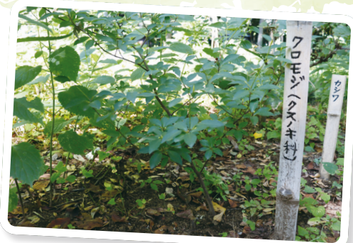
クロモジ(黒文字) 花期5~8月