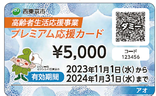
↑画像はイメージです