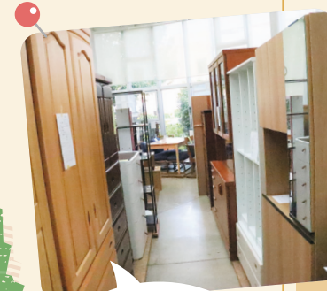
リサイクルされた 家具は、 エコプラザで 販売しています!