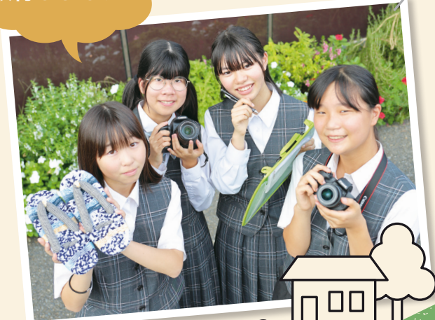
田無第二中学校 子ども記者のみなさん