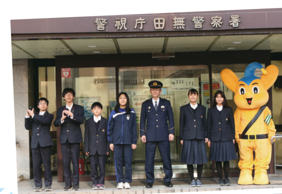
田無第三中学校 子ども記者のみなさん