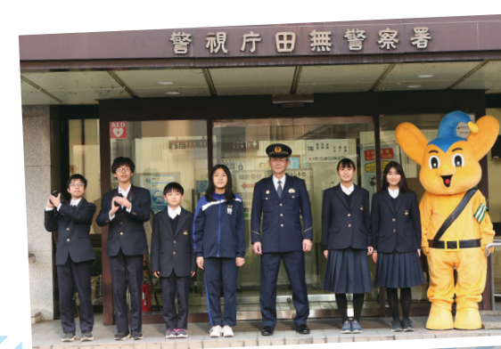
田無第三中学校 子ども記者のみなさん