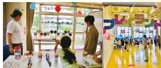
「しもじゅく夏祭り2023 in きらっと」(令和5年8月)