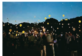
「ユメバルーンを夜空へ。」(令和5年9月)