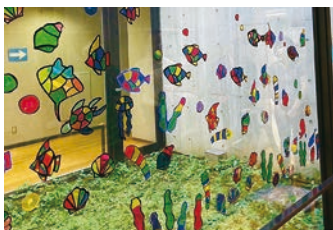
「水族館を作ろう！」(令和5年7月)