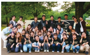
「JUN SKY WALKER(S) Free Live in Nishi-Tokyo "Birthday Party"」(令和5年5月)