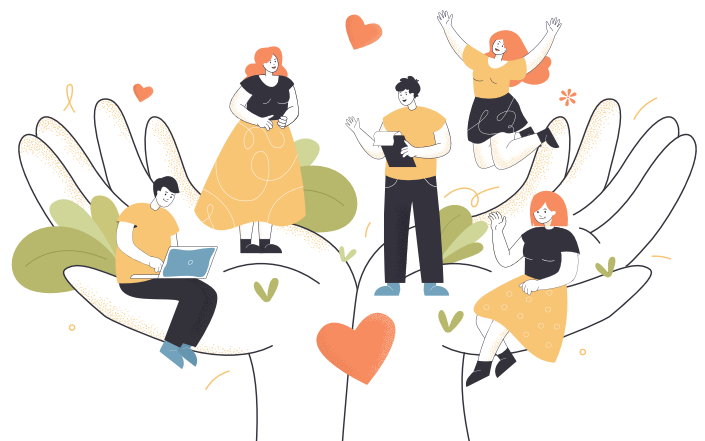
冊子デザインお手伝い： (株)エフエム西東京／(有)ヤギサワベース