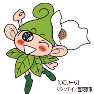
「いこいな」 ©シンエイ/西東京市