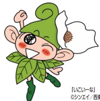
「いこいな」