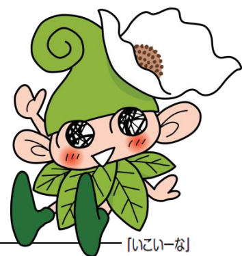
「いちいな」 ©シンエイ/西東京市