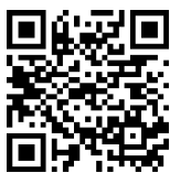
職員採用試験申込ページ

西東京市職員採用試験申込ページ より入力フォームに従って必要事項を入力してください。