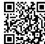
職員採用試験 申込ページ