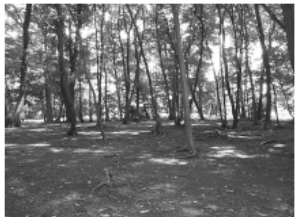
碧山森緑地保全地域

市の北東部に位置するみどりの核、中心地として、北町緑地保全地域とその周辺を位置づけます。