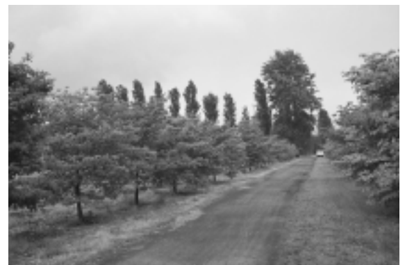
東京大学附属農場・演習林

この周辺では、特にまとまったみどりの保全と創出を図り、市のシンボルとなるようなみどり豊かな区域づくりを目指します。（以下の「みどりのシンボル拠点」についても同様です。）