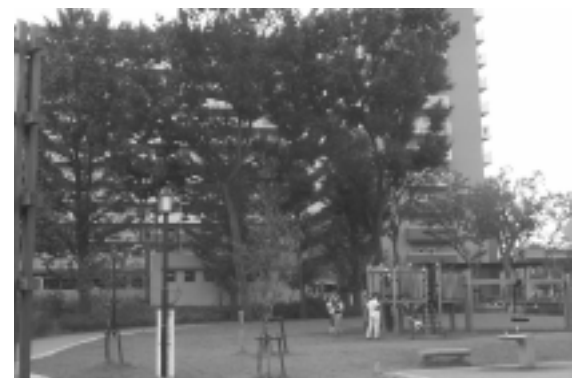
谷戸せせらぎ公園

市の中央やや北側に位置する比較的新しいみどりの核、中心地として、東大原子核研究所跡地に整備中の（仮称）合併記念公園や、明治薬科大学跡地に整備された谷戸せせらぎ公園とその周辺を位置づけます。