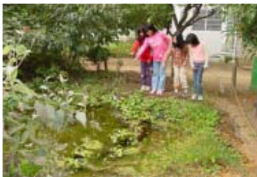
ビオトープ池を観察する子どもたち

そのためには、私たちの生活や事業活動を見直すことが大切であり、環境に配慮した循環型で持続可能な地域社会へと移行していく必要があります。