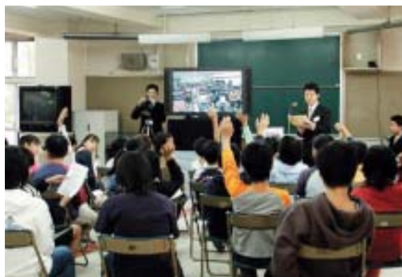
長崎県の五島列島にある小学校と市内の小学校との遠隔授業(離島地域における地域公共ネットワーク構築のための実証実験)

また、市民が安心して情報のやりとりができるようにするために、個人情報の保護とセキュリティ対策にも十分配慮する必要があります。