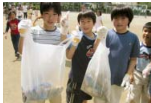
捨てられた空き缶などを集める子どもたち