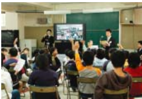
基本構想・基本計画案の策定過程において開催された市民ワークショップ

計画的にまちづくりをすすめるためには、「計画-実行-評価-改善」といったサイクルを市民と行政が協力しながらすすめていく必要があります。