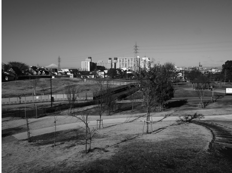
都立東伏見公園（平成 31（2019）年 3 月）