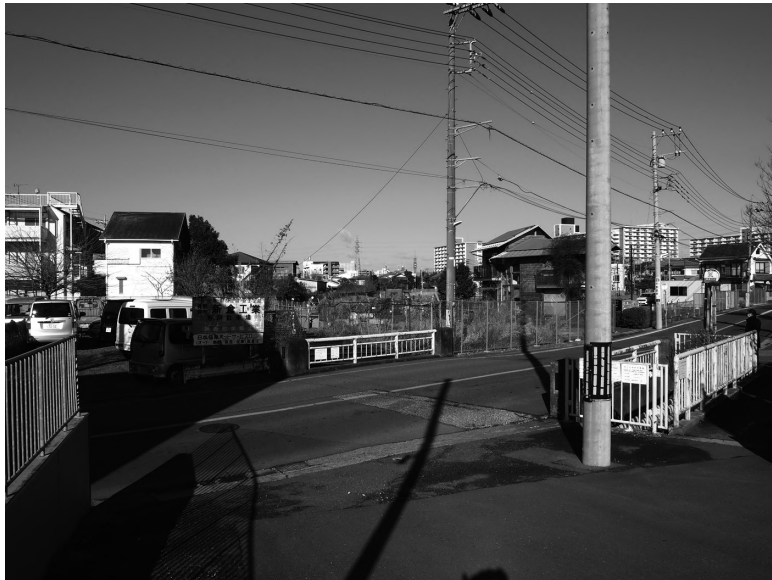
石神井川沿いの都立東伏見公園の整備予定地（平成 31（2019）年 3 月）