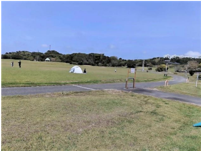
西海市「33° 元気らんど」