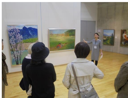
展示作品を使った対話による美術鑑賞