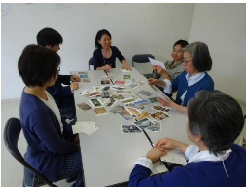
アートカードゲーム体験