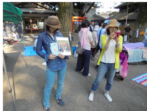
アートミーる活動PR