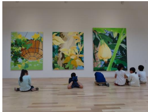
美術館における「対話による美術鑑賞」事業実施風景