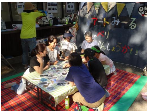
アートカードゲーム体験