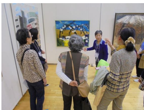
展示作品を使った対話による美術鑑賞