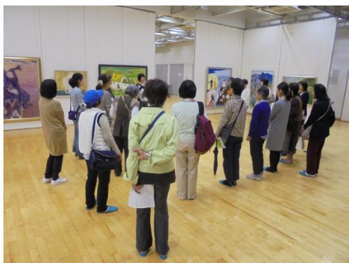
体験会内容の説明