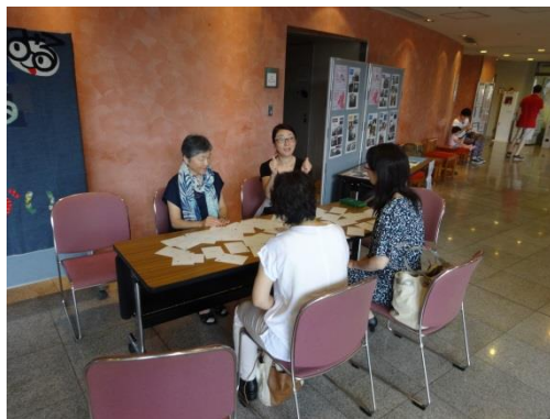
保谷こもれびホールロビーでの体験会