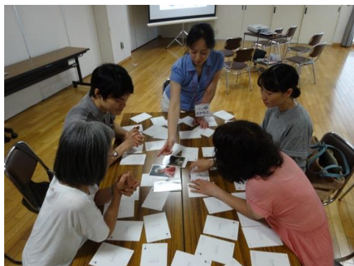
アートカードゲーム体験