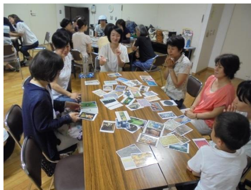
アートカードゲーム体験