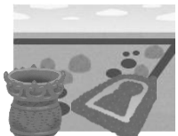
遺跡・城址・出土品