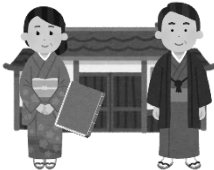
歴史上の偉人や そのゆかりの場所