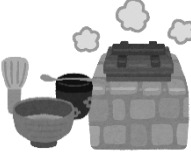
生活文化・民具など