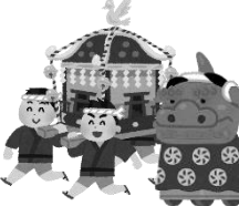
伝統的な祭・行事