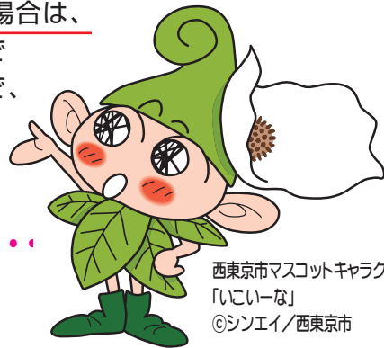
西東京市マスコットキャラクター 「いーな」 ©シンエイ/西東京市

この制度は、通常の学級に入学する新1年生を対象とし、西東京市教育委員会が就学予定児童・生徒の保護者へ就学校（入学する小・中学校）を通知する前に、保護者が西東京市立小・中学校の中から入学を希望する学校を事前に申し立てることができる制度です。 住所地の指定校に入学される場合は、お手続きの必要はありません。 （住所地の指定校については内面の学校一覧でご確認ください。）各学校の施設状況等により受入枠を設定していますので、この枠を超える申し立てがあった場合には、抽選となります。あらかじめご了承ください。また、施設状況等により本制度による受入れができない学校がありますので、学校一覧をご確認の上、申し立てをお願いします。