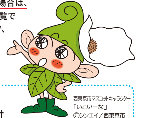
西東京市マスコットキャラクター「いーな」 ©シンエイ/西東京市

この制度は、通常の学級に入学する新1年生を対象とし、西東京市教育委員会が就学予定児童・生徒の保護者へ就学校(入学する小・中学校)を通知する前に、保護者が西東京市立小・中学校の中から入学を希望する学校を事前に申し立てることができる制度です。 住所地の指定校に入学される場合は、お手続きの必要はありません。 (住所地の指定校については内面の学校一覧でご確認ください。)各学校の施設状況等により受入枠を設定していますので、この枠を超える申し立てがあった場合には、抽選となります。あらかじめご了承ください。また、施設状況等により本制度による受入れができない学校がありますので、学校一覧をご確認の上、申し立てをお願いします。