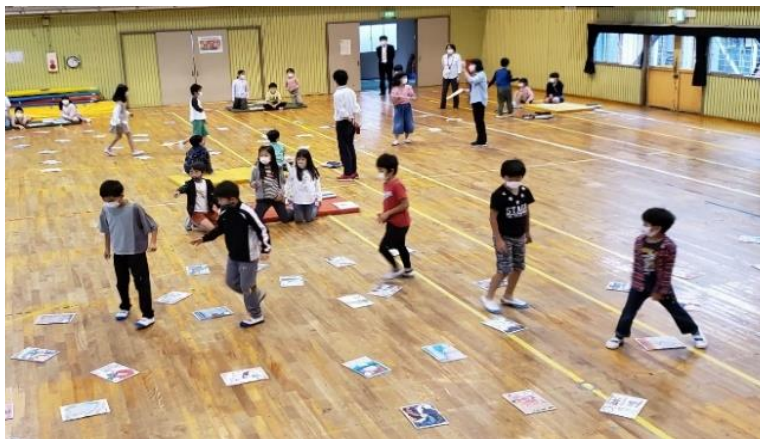
③市民団体(西東京市カルタ制作委員会)と協働でカルタ体験授業(碧山小)