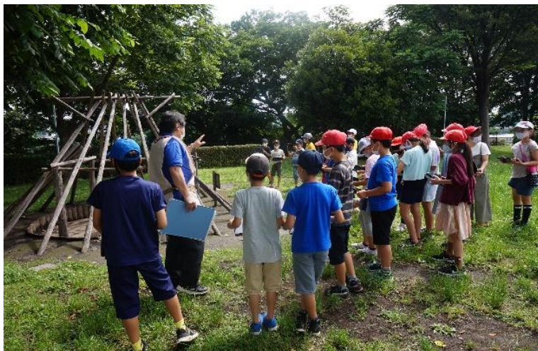
①学芸員・文化財専門員による下野谷遺跡での授業(東伏見小)