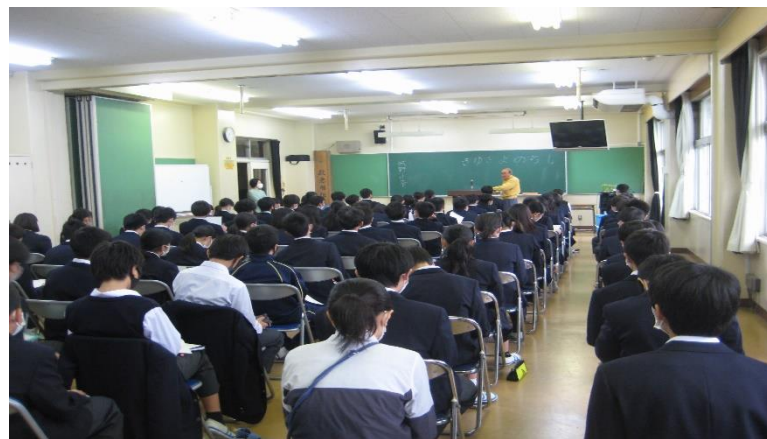
④地域の方と協働で弁論大会に向けた話し方に関する授業(柳沢中)