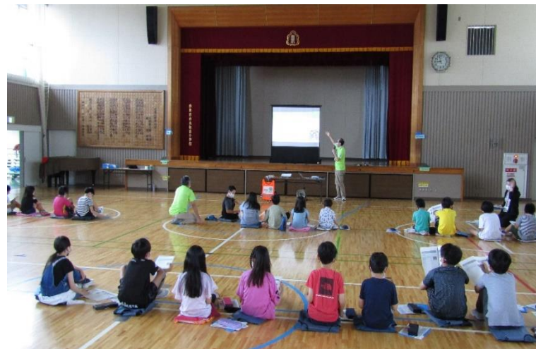
②市民団体(西東京レスキューバード)と協働で災害に関する授業(住吉小)