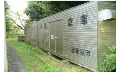
西東京市の備蓄コンテナ

○応急給水・放水訓練(校庭) 9:50~10:50 東京都水道局から貸与された応急給水資器材を活用し、消火栓からの応急給水・初期消火訓練を実施します。