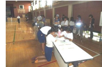
過去の訓練の状況

○避難施設開設訓練(体育館) 9:20~11:00 大災害時に避難所が開設される場合を想定し、東小学校体育館で、避難者を受け入れる訓練を実施します。