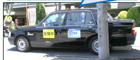
実証実験のタクシー車両