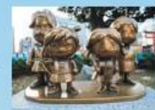
縄文モニュメント

3月 東伏見駅周辺に縄文モニュメント登場 4月 ひばりが丘駅北口バリアフリー化 9月 子ども条例制定 12月 東京2020オリンピック・パラリンピック競技大会に向けた、オランダ王国のホストタウンに登録