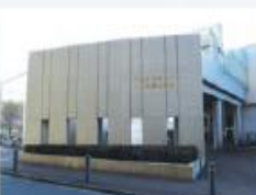
下保谷児童センター

2月 インターネット議会中継開始 10月 下保谷児童センター・下保谷福祉会館開設