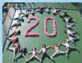
保育園の子どもたち

平成13年1月、田無市と保谷市が合併し、約18万人の人口を有する西東京市が誕生しました。 それから20年。西東京市のこれまでの市政の取り組みやイベントなど当時の写真とともに振り返ってみましょう。