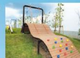
ひばりが丘 さくらの道公園

2月 地域協力ネットワーク設立(南部地域) 11月 放置自転車供与により、カンボジア政府から感謝状と勲章を受領 12月 証明書コンビニ交付サービス開始