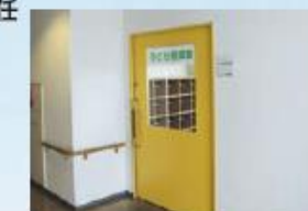
子ども相談室 ほっとルーム

1月 ひばりが丘中学校<新校舎>竣工式 3月 ひばりが丘駅北口線開通、駅前広場開設 7月 健康都市連合日本支部長市に就任 8月 子ども相談室 ほっとルーム開設 10月 資源物の戸別収集開始