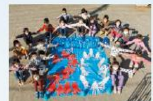
保育園の子どもたち

1月 田無第二庁舎完成 3月 共生社会ホストタウンに登録 9月 泉小わくわく公園全面開園