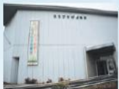
エコプラザ西東京

1月 家庭ごみの市指定収集袋(有料)による収集開始 4月 住吉会館「ルピナス」開設 6月 エコプラザ西東京開設 保谷駅前公民館・保谷駅前図書館開設