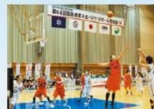
国民体育大会 バスケットボール会場