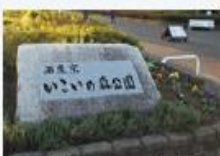
西東京 いこいの森公園