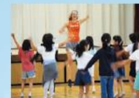
パラアスリートとの交流