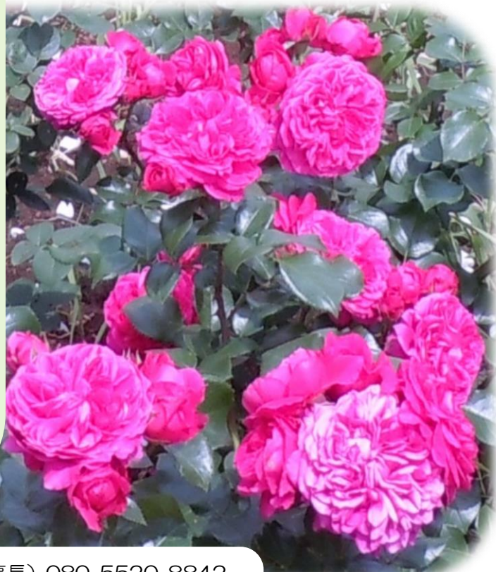
レッド レオナルド ダ ビンチ

※保谷ローズ倶楽部の主な活動日は金曜日の午前中。5～6月は月曜日と金曜日の午前中。冬季は 10 時から、夏季は 9 時から作業を始めています。