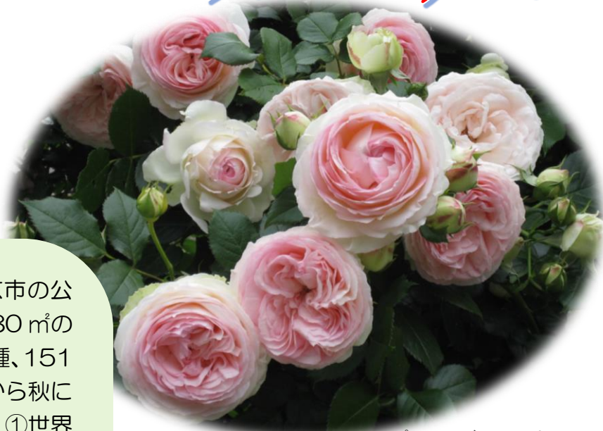
ピエール ドゥ ロンサール

「保谷町ローズガーデン」は西東京市の公園として常に開放されています。約 280 m 2 の敷地に植栽されているバラは 149 品種、151 株あり、四季咲き品種も多いので、春から秋にかけて咲きそろいます。8つのテーマ、①世界殿堂入りのバラ②オールドローズ③有名人・芸術家の名を冠したバラ④王室・皇室の名を冠したバラ⑤イングリッシュローズ⑥希望（黄・オレンジ色のバラ）⑦気品（白・紫色のバラ）⑧情熱（赤・ピンク色のバラ）に分類されており、テーマ花壇の間のフェンスと入口アーチにはつるバラが咲き競います。