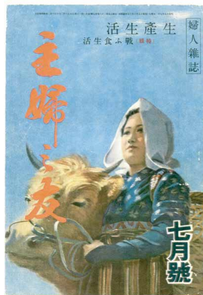
『主婦の友』1944(昭和19)年 7月号 表紙と裏表紙