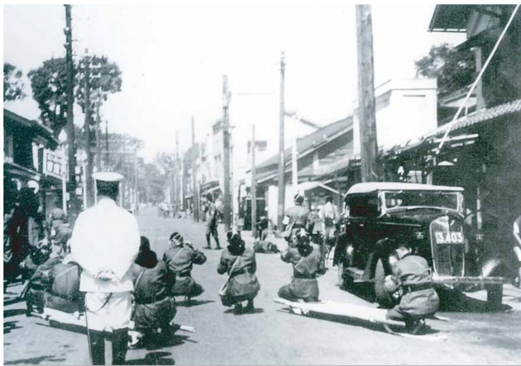
警防団の指導のもと、青梅街道で行われた防空演習 1940(昭和15)年

翌年には国家総動員法が公布され、戦争遂行のための物資統制や金属回収、軍費捻出のための貯蓄増進など、国民が戦争に奉仕させられる体制ができあがりました。さらに1940(昭和15)年には大政翼賛会が結成され、地域には町内会や隣組が設けられ、国民は戦時体制に組み込まれていきました。