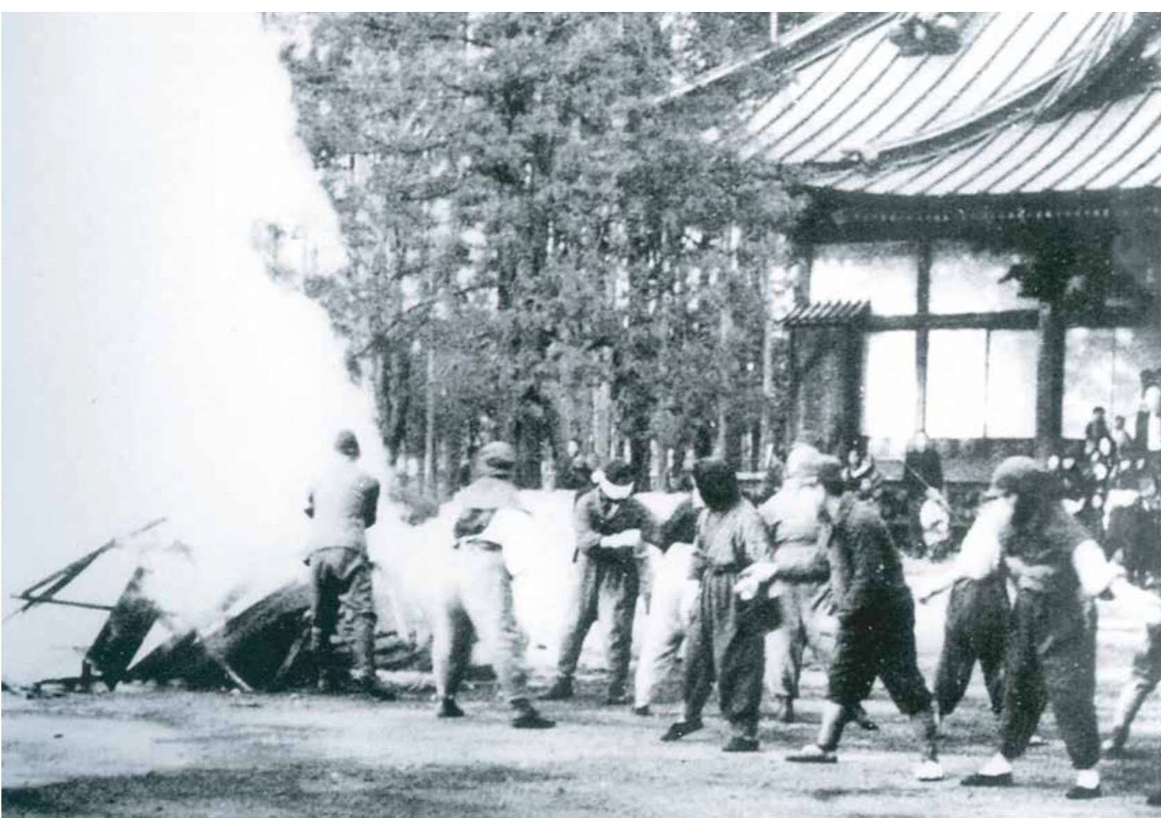
バケツリレーによる防火訓練 1944(昭和19)年頃 総持寺境内にて