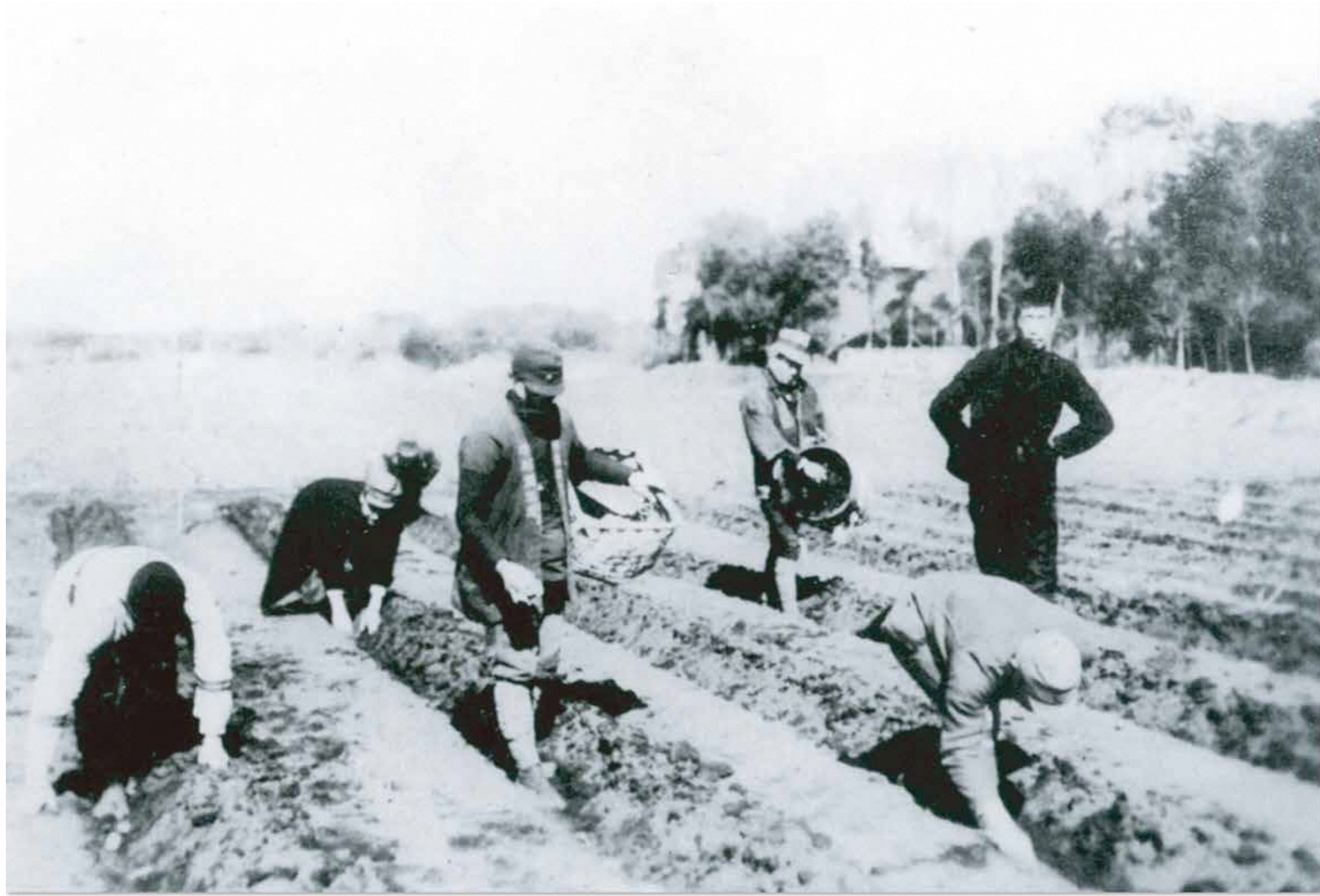
じゃがいもを植える翼賛壮年団 1942(昭和17)年

翼賛壮年団は1942(昭和17)年に結成され、人手の足りなくなった農家に行って、農作業を手伝った。食糧不足で、食糧の増産が国民に課せられていた。