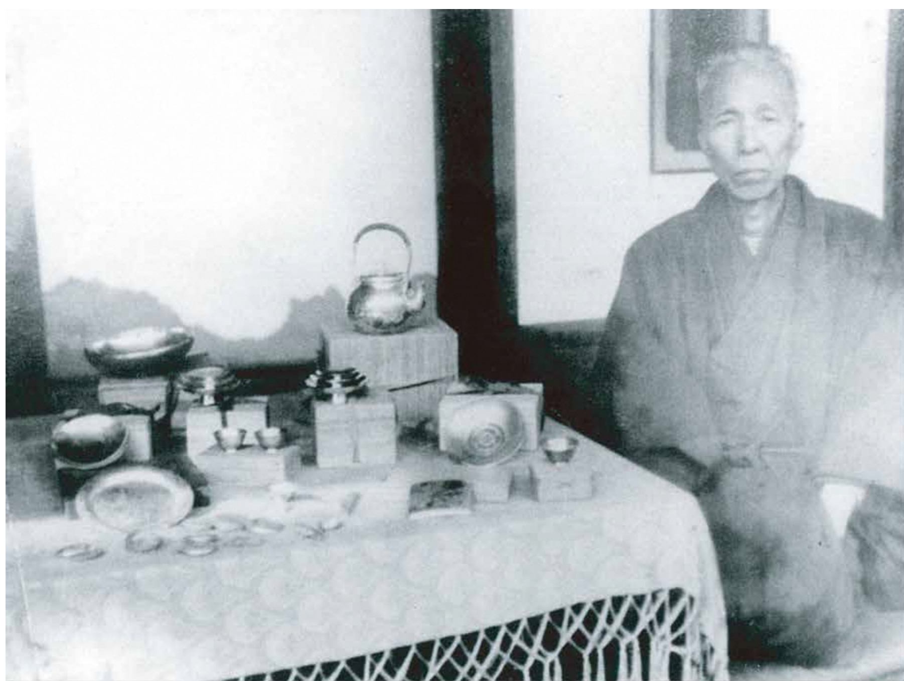
供出される金属器 1941(昭和16)年頃