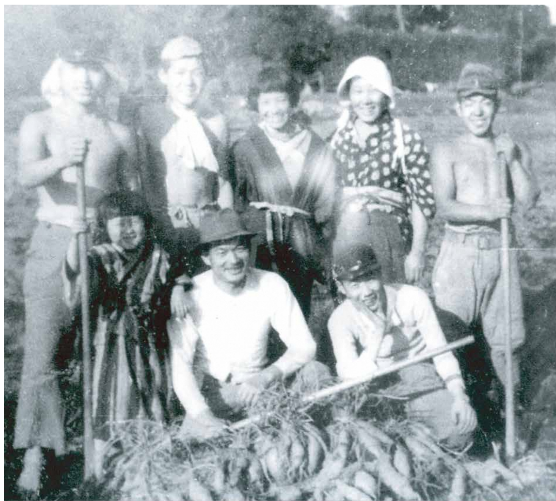
食糧増産のための勤労働員 1943(昭和18)年頃

翼賛壮年団は1942(昭和17)年に結成され、人手の足りなくなった農家に行って、農作業を手伝った。食糧不足で、食糧の増産が国民に課せられていた。