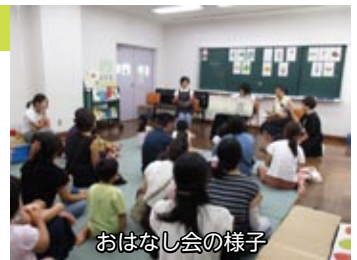
おはなし会の様子

『いろいろなことばでたのしむおはなし会』として、昨年8月にひばりが丘図書館で、1月には芝久保図書館で、英語・中国語・韓国語を母語とする方によるおはなし会を実施しました。