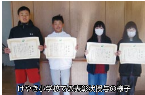
けやき小学校での表彰状授与の様子