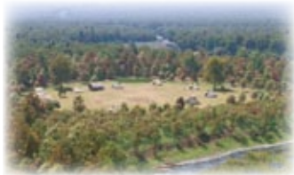
「したのやムラ想定図」 VR下野谷縄文ミュージアムより