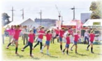
縄文の森の秋まつり

指定から5年がたち、調査、講演会、VR下野谷縄文ミュージアム、縄文の森の秋まつりなどを通して多くの方々に下野谷遺跡の魅力を知っていただきながら、保存・活用・整備の計画を作成してきました。今後は「縄文から未来へ したのやから世界へ」を保存活用の基本方針として、「みんなでつくる、つなげる都市部の縄文空間」をテーマに、史跡を未来に繋ぎ、地域の宝として活かす史跡整備・活用を皆さまと一緒に進めていきます。