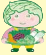
西東京市 農産物キャラクター 「めぐみちゃん」