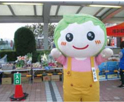
「マルシェ・ド・ソワレ」の様子

今年度についても、「市民と農業者の交流」を意識した各種イベントを実施していきます。市内の農業を盛り上げていけるよう、農業者の皆さまのご協力を何卒よろしく願っています。