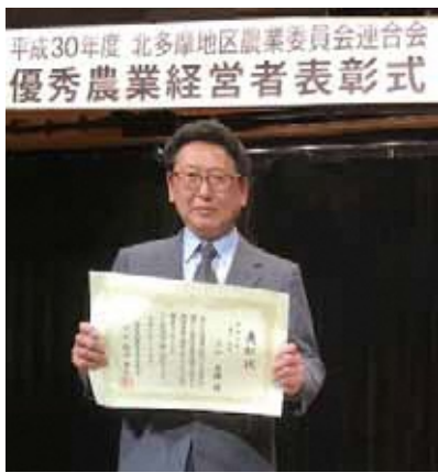
平成30年度 北多摩地区農業委員会連合会 優秀農業経営者表彰式

「名誉ある賞をいただき、関係各位の皆様にご感謝申し上げます。農業を代々引き継ぎ、農地を大切に守り続けた結果の受賞と私は考えます。自分の立ち位置はあくまでも中継ぎと思っており、難しさはありますが創意工夫をもって次世代に都市農業の魅力を伝えていきたいと思っています。」