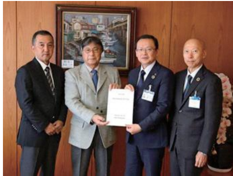
（左より：野口会長職務代理、保谷会長、池澤市長、萱野副市長）