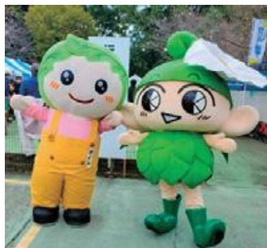
西東京市マスコットキャラクター「いこいちーな」(右)と一緒に。

また、毎回恒例の野菜で作られた宝船も展示され、来場者の注目を集めていました。12日の午後に行われた宝船の野菜の宝分けは、大変な人気を博し、品評会に出品された農産物の販売とともに、多くの来場者の方々に市内産農産物をPRする機会となりました。