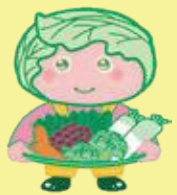
西東京市 農産物キャラクター 「めぐみちゃん」