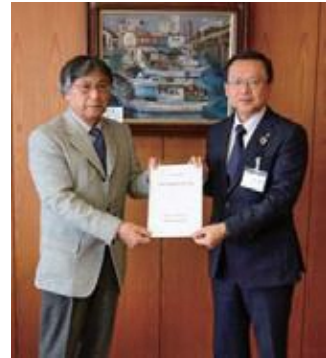
意見書提出（左：保谷会長、右：池澤市長）