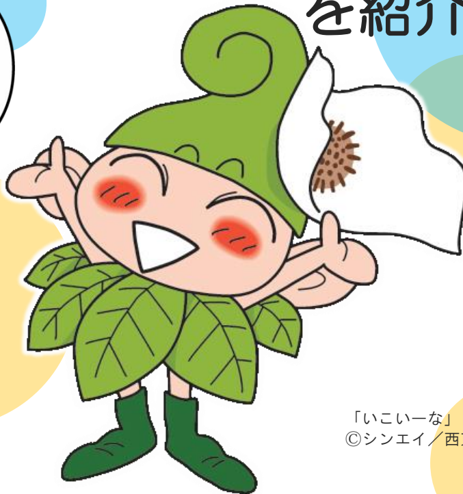
「いこいな」 ©シンエイ/西東京市

つぎのページから、 子ども条例に書かれている 内容をさらに詳しく 紹介していくよ！